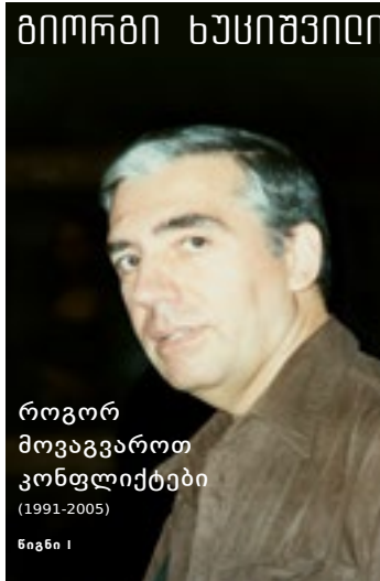
Как разрешить конфликты (1991-2005) Книга I, на грузинском языке