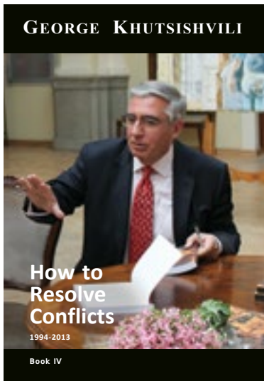
Как разрешить конфликты (1994-2013) Книга IV, на английском языке