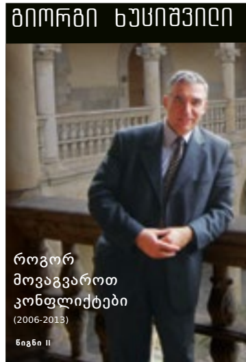
Как разрешить конфликты (2006-2013) Книга II, на грузинском языке