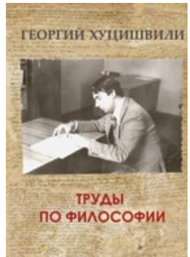
Труды по философии Книга V, на русском языке