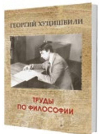
შრომები ფილოსოფიაში წიგნი V, რუსულ ენაზე