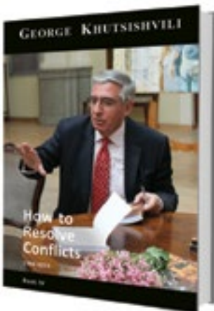
როგორ მოვაგვაროთ კონფლიქტები (1994-2013) წიგნი IV, ინგლისურ ენაზე