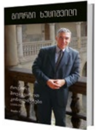
როგორ მოვაგვაროთ კონფლიქტები (2006-2013) წიგნი II, ქართულ ენაზე