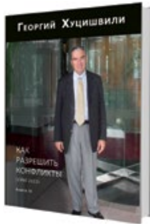
როგორ მოვაგვაროთ კონფლიქტები (1990-2013) წიგნი III, რუსულ ენაზე